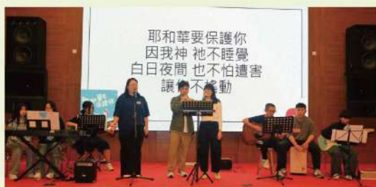
恩安青少敬拜隊初次啼聲