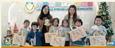
小一生為幼稚園母校送上毛巾熊