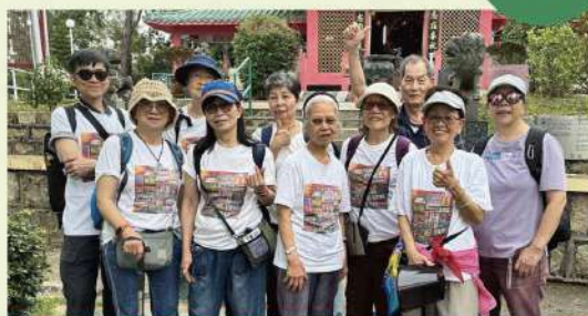
長者團契長洲一天遊

暑假將至，合適的暑期活動不可或缺，亦不能少，如(但不限止)：暑期聖經班(初小級)、少年營會、興趣工作坊；而負責青少年事工的教牧同工更要騰出時間、空間接待及陪伴小羊，極需要肢體的禱告與守望。家長作為子女的陪行、同行者，暑假也相當忙碌，也請記念他們身心靈需要。