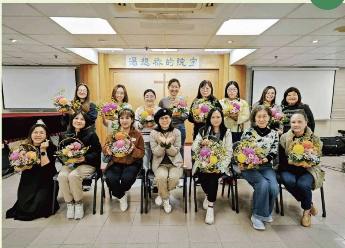
插花班-導師同學大合照