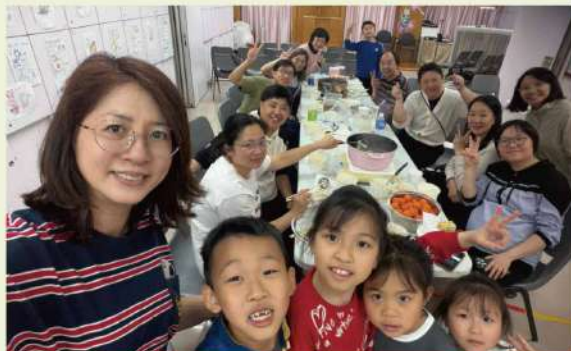
肢體們與English Fun Group家庭年初四舉行開心火鍋活動