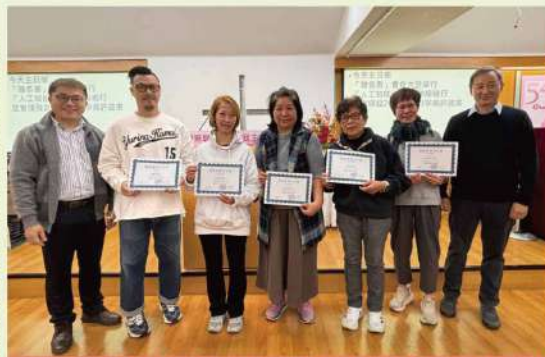
主日學培育計劃第一批完成的弟兄姊妹