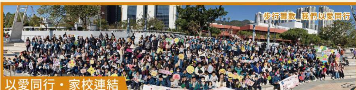
步行籌款 我們以愛同行