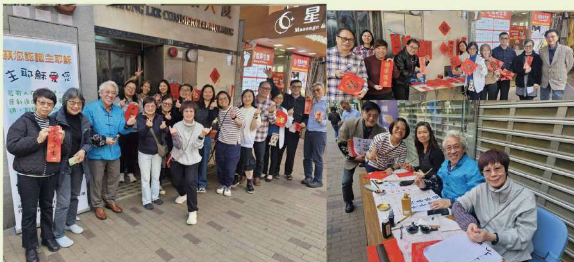
街頭派揮春，祝福街坊