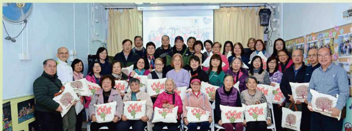
馬年派發福袋給年滿 65 歲長者