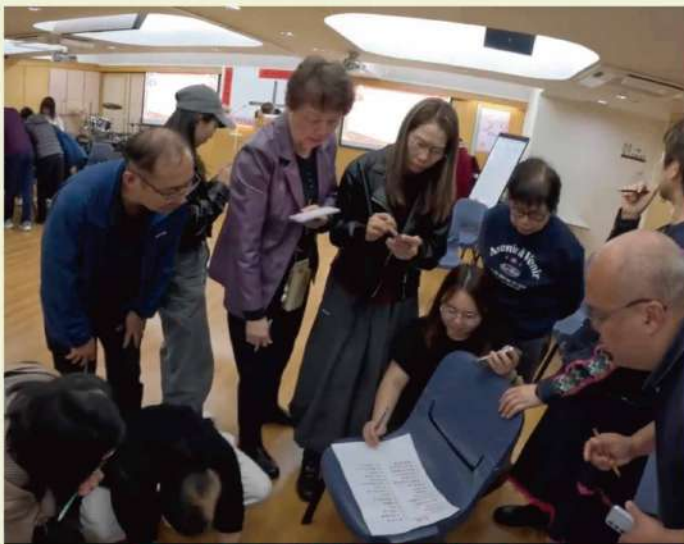
新春團拜「宵腦急轉彎」肢體急劇燒腦中

主日學課程也進行了改革，從一年六個課程，轉為在每季中，「雙軌制」開辦兩個為期五堂的課程，在崇拜後同時舉行，讓弟兄姊妹能依需要和興趣選擇，並支援網上重溫。這樣，弟兄姊妹能在沒有課堂的主日，有更多彼此分享、連結的機會。盼望透過這些改變，大家能更敞開心扉學習與交流。