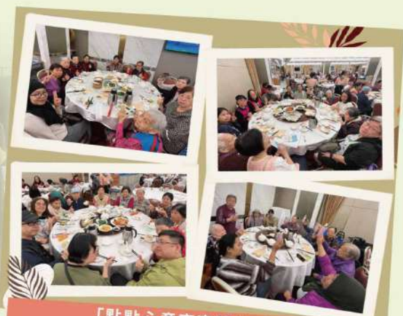
「點點心意齊齊團年」午宴