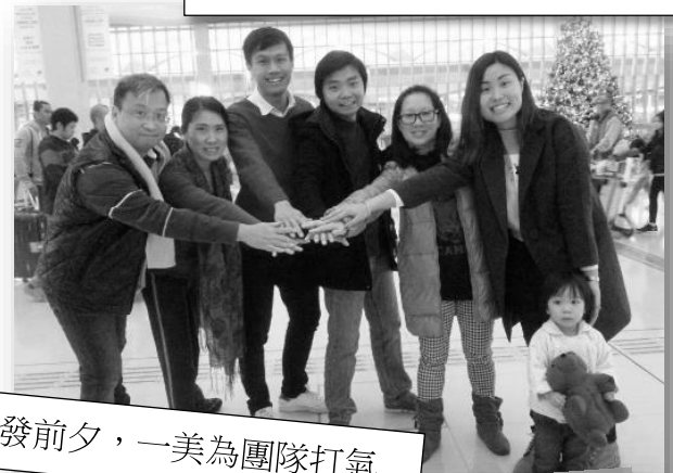
出發前夕，一美為團隊打氣