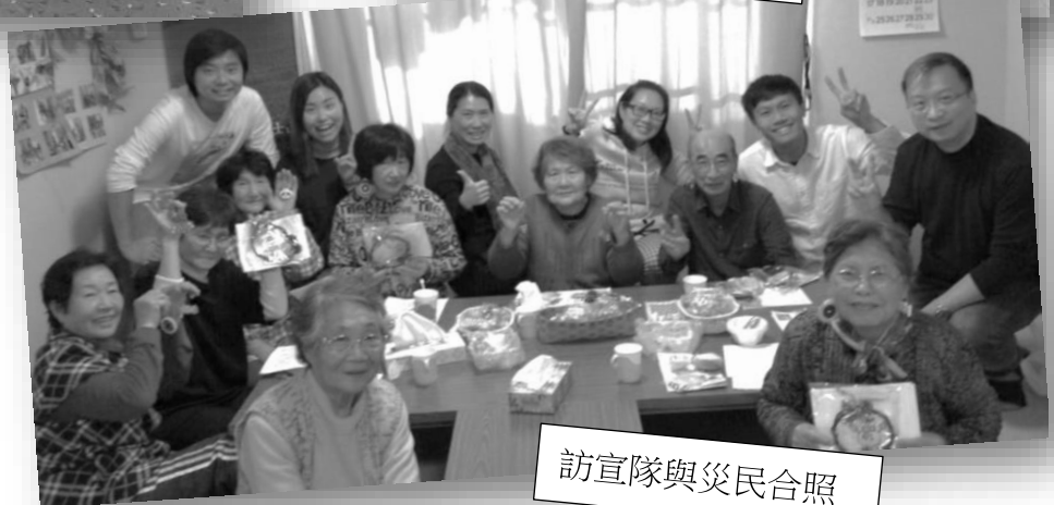
訪宣隊與災民合照