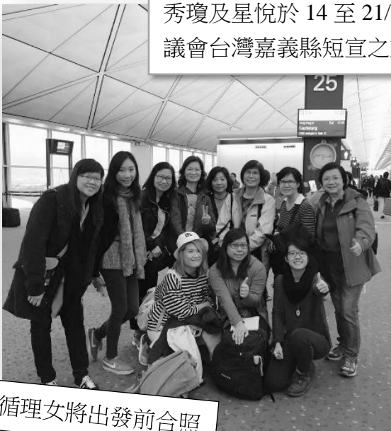
循理女將出發前合照