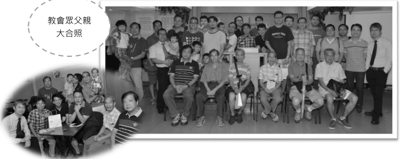
教會眾父親 大合照