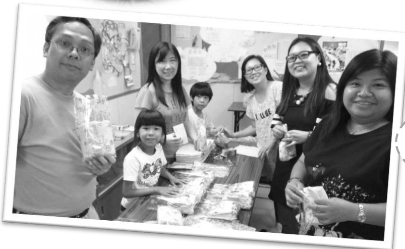
探訪前，弟兄姊妹預備 禮物包送給醫院病人