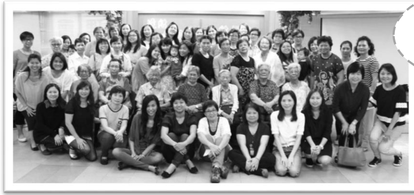
教會眾母親與新朋友 大合照