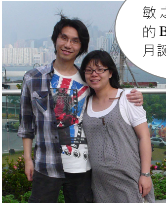
敏之與美寶的BB將於九月誕生。