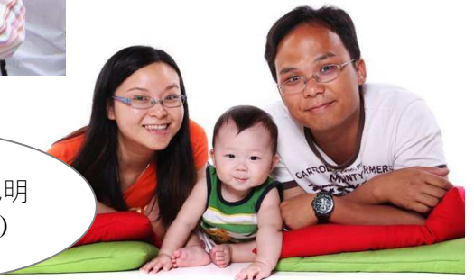
還有樂軒 BB (兆明和慧文的小寶貝)